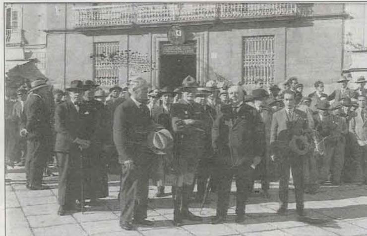
Un momento de la visita de Baden Powell a Tenerife en 1915.

Baden Powell viajó por todo el mundo para propagar su método de enseñanza e incluso estuvo en Tenerife. Su objetivo siempre fue estar allí donde más se le necesitara para hacer crecer la enseñanza, siempre al servicio de la juventud, y a través de un método que el mismo creó.