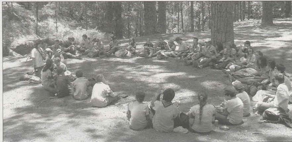
Encuentro entre varios grupos de scout de la Isla en el monte de Las Raíces.

Poco a poco se fueron creando grupos, pequeñas tropas que convivían y trabajaban de forma coordinada en la naturaleza. Su dilema